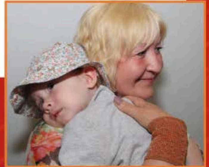
Die kfd-Stiftung unterstützt viele arme Familien. Wir wollen, dass Kinder gesund aufwachsen und bei ihren Eltern geborgen sind.