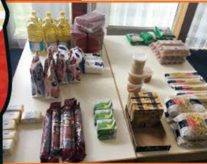
Grundnahrungsmittel wie Öl, Nudeln oder Eier gehören mit in die Lebensmittelpakete für die armen Familien.

Das kostet für eine Familie pro Monat 60 Euro.