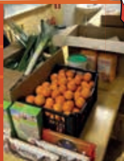
Die kfd-Stiftung unterstützt viele arme Familien. Wir wollen, dass Kinder gesund aufwachsen und bei ihren Eltern geborgen sind.